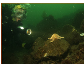
IAHD duiken met mindervalide