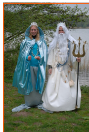
INTRODUCTIE DUIKEN - DUIKEVENEMENTEN